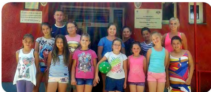
U 10-es korosztályú kézilabdázók

Az egyesület úszói a nyári szünet ellenére sem hagytak fel az edzésekkel Csak kis időre lesz leállás, mégpedig az uszoda vízének cseréje miatt