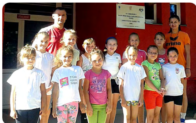
U 8 -as kézis leánycsapat